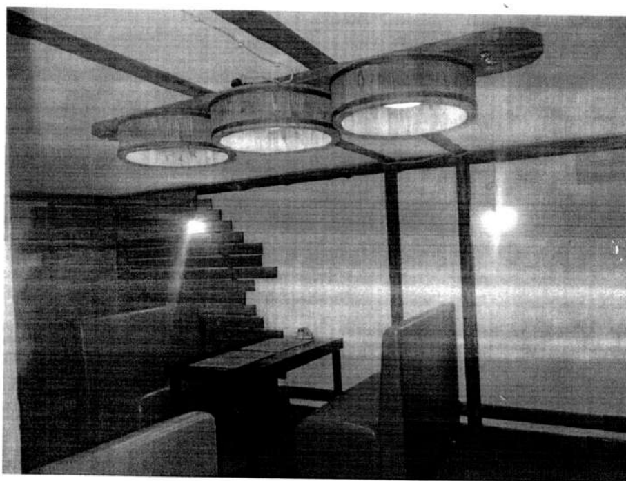
Фото 4. Фрагмент интерьера первого этажа здания (приспособление под шашлычную). Вид с юга. 2020 год.