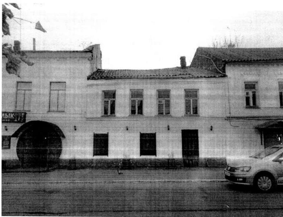
Фото 1. Восточный лицевой фасад здания. Вид с востока. 2020 год