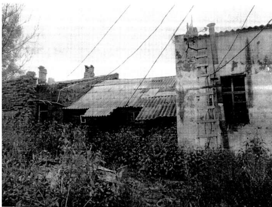
Фото 2. Дворовый западный фасад здания закрыт поздней аварийной деревянной пристройкой. Вид с юго – запада. 2020 год.