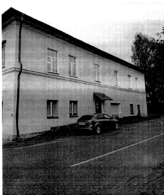
Фото 3. Северный фасад здания. Вид с северо – востока. 2020 год.

Новгородская обл., Валдайский район, г. Валдай, ул. Труда, д. 9