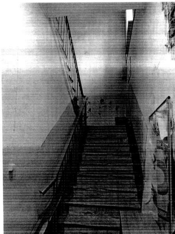
Фото 6. Фрагмент лестничной клетки правого крыла. Вид с запада. 2020 год.