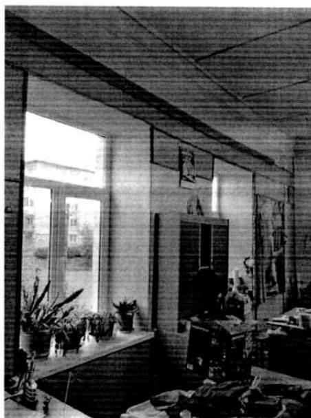
Фото 8. Фрагмент интерьера правого крыла первого этажа.