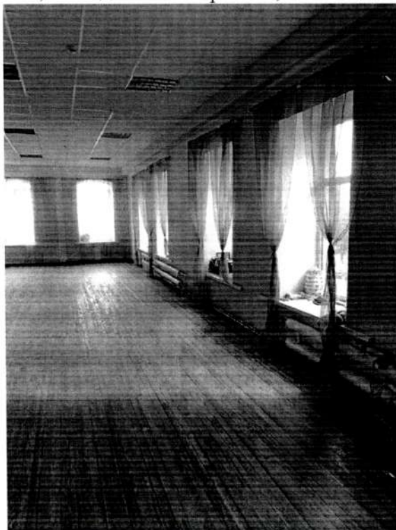
Фото 5. Фрагмент интерьера второго этажа левого крыла.

Новгородская обл., Валдайский район, г. Валдай, ул. Труда, д. 9