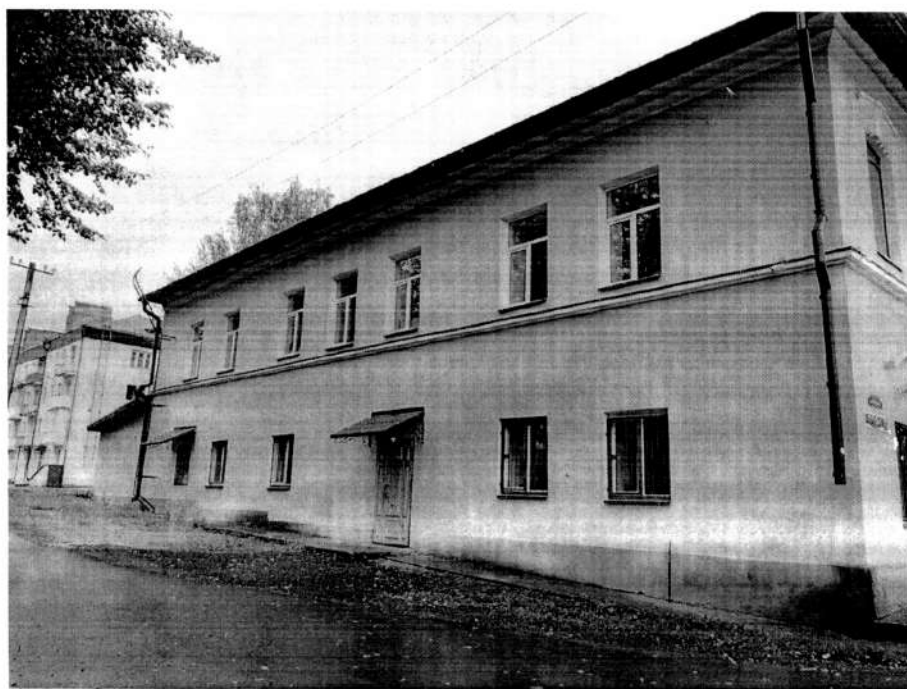
Фото 2. Южный фасад здания. Вид с юго – востока. 2020 год.