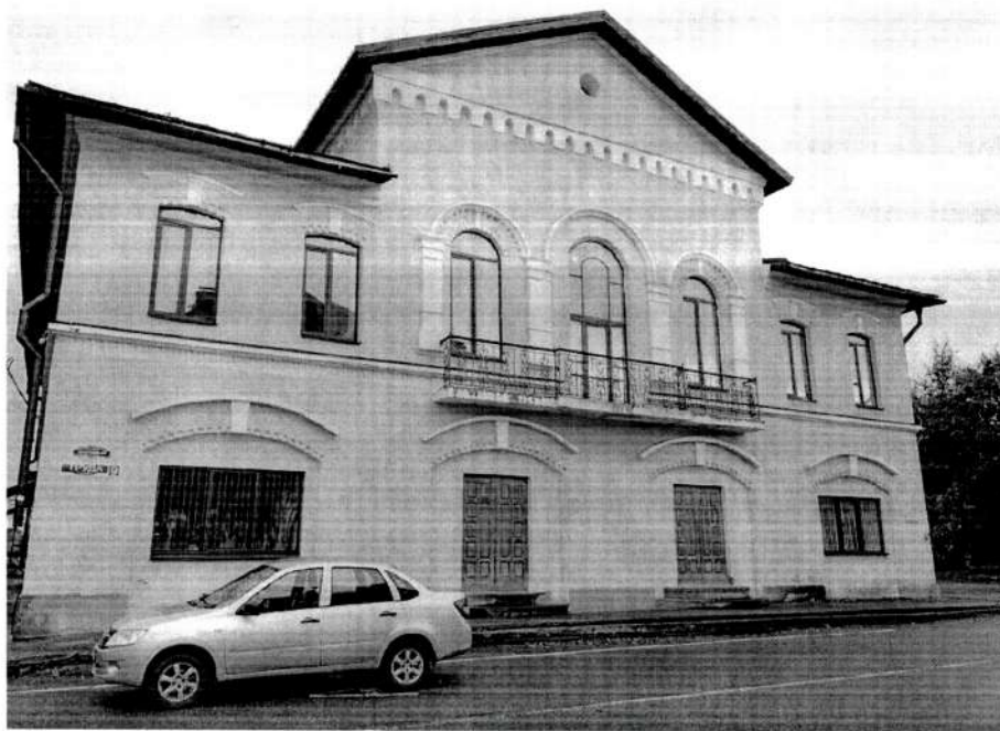
Фото 1. Лицевой восточный фасад здания. Вид с юго – востока. 2020 год.

Новгородская область, Валдайский район, г. Валдай, ул. Труда, д. 9