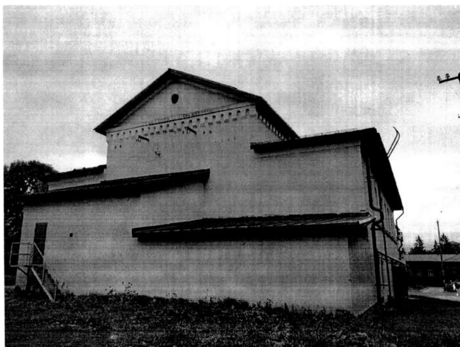
Фото 4. Западный фасад здания. Вид с юго – запада. 2020 год.