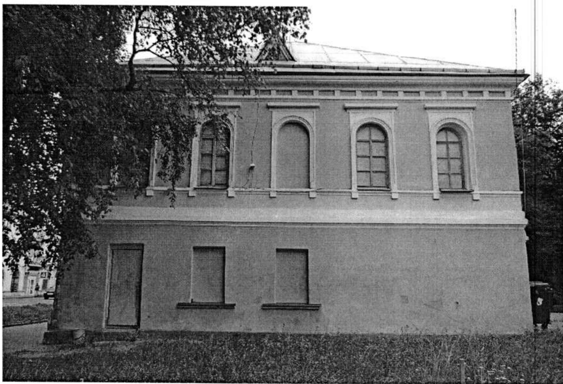
Фото 4. Южный фасад. Июнь 2020 года.