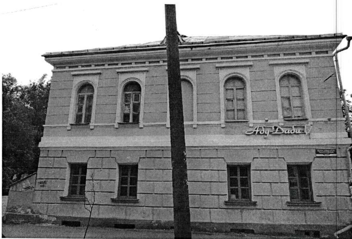
Фото 2. Северный (лицевой) фасад. Июнь 2020 года.