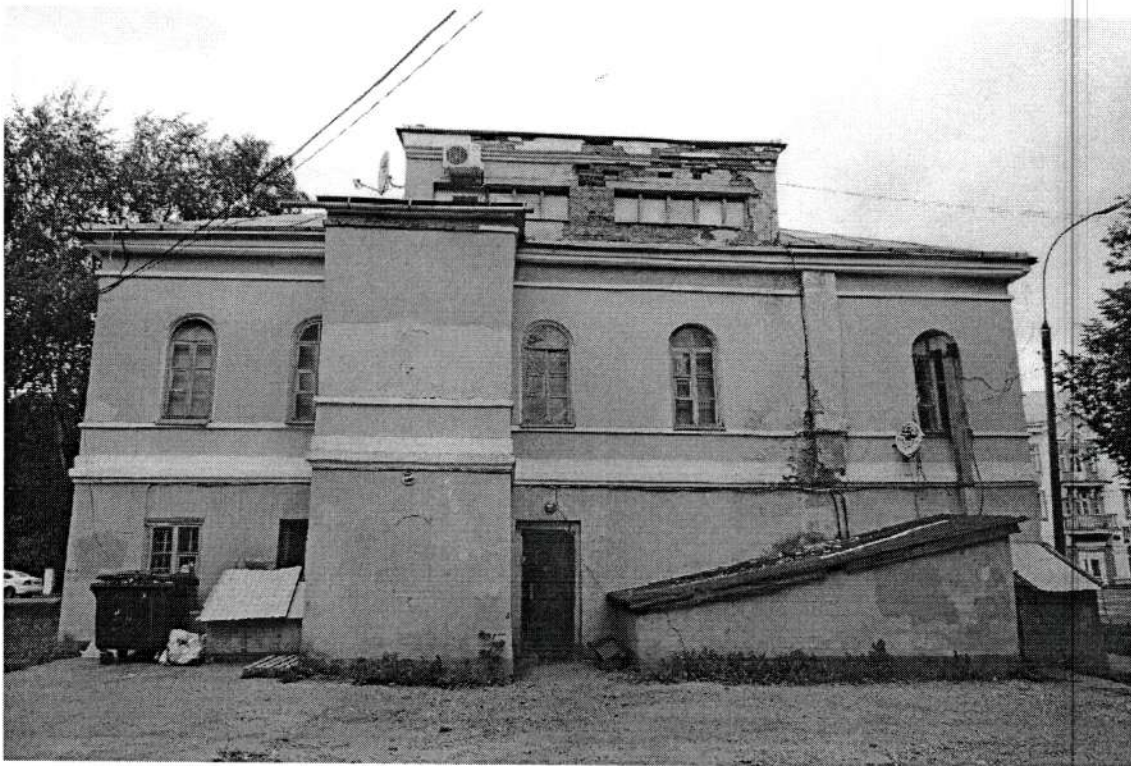
Фото 3. Восточный (дворовой) фасад. Июнь 2020 года.