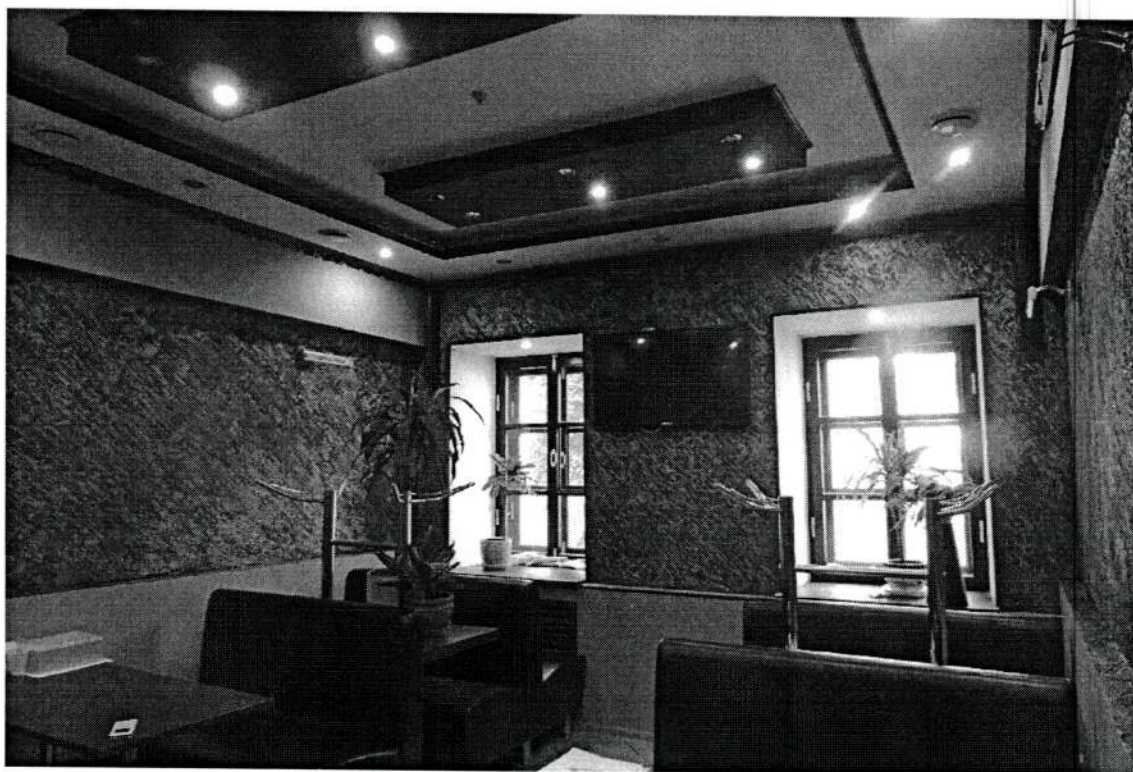
Фото 6. Интерьер первого этажа. Июнь 2020 года.