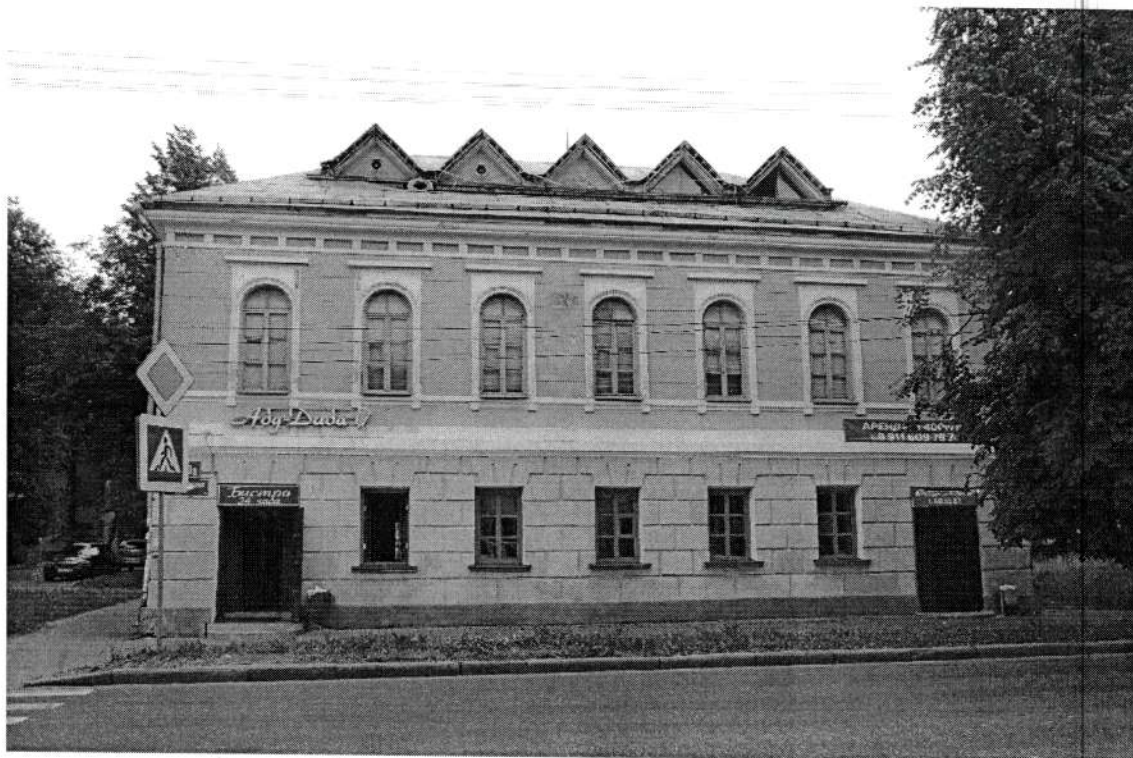
Фото 1. Западный (лицевой) фасад. Июнь 2020 года.

Великий Новгород, ул. Большая Московская, 50/8