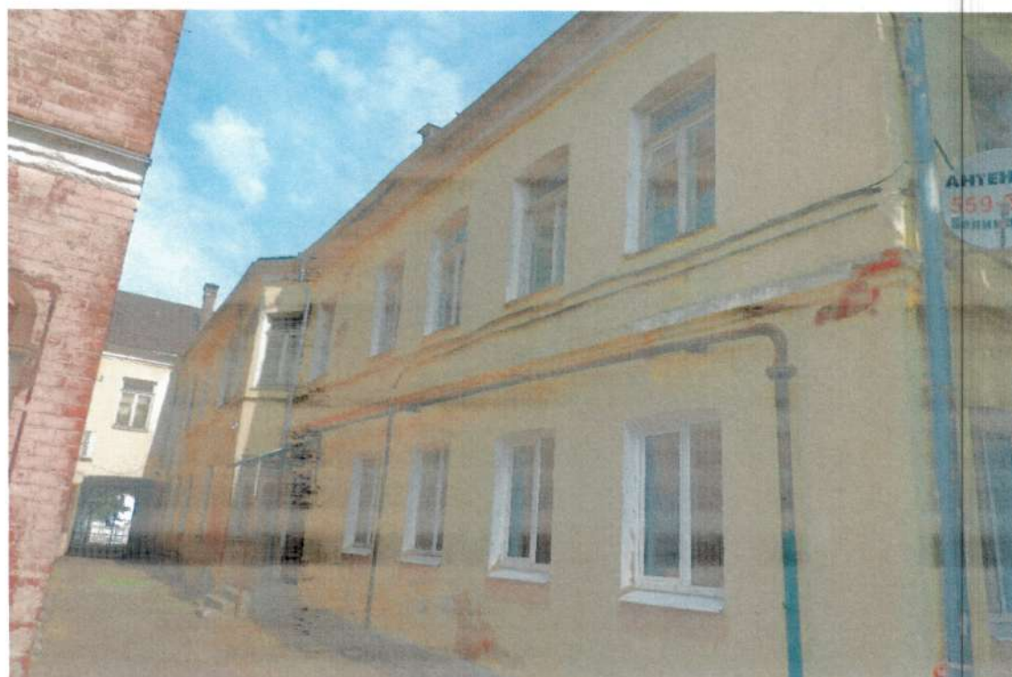
Фото 2. Вид на южные фасады. Июнь 2020 года.