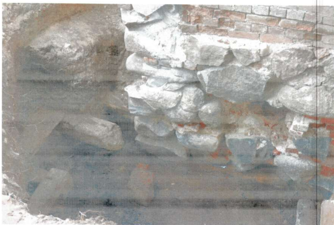
Фото 6. Остатки каменной кладки бастиона. Июнь 2020 года.