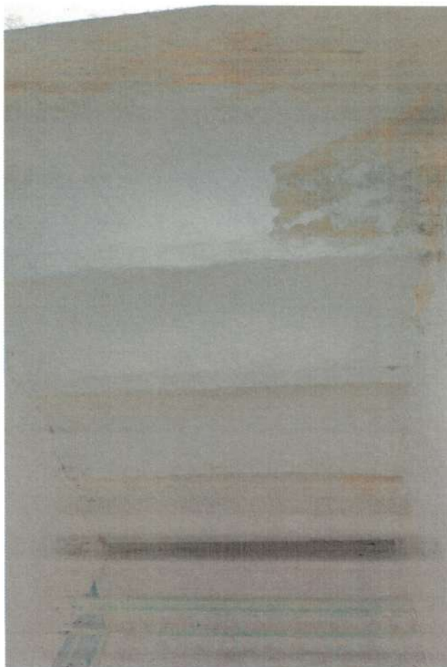
Фото 2. Лурные сводки по металлическим балкам в подьезде дома периода 1905 года. Июнь 2020 года.