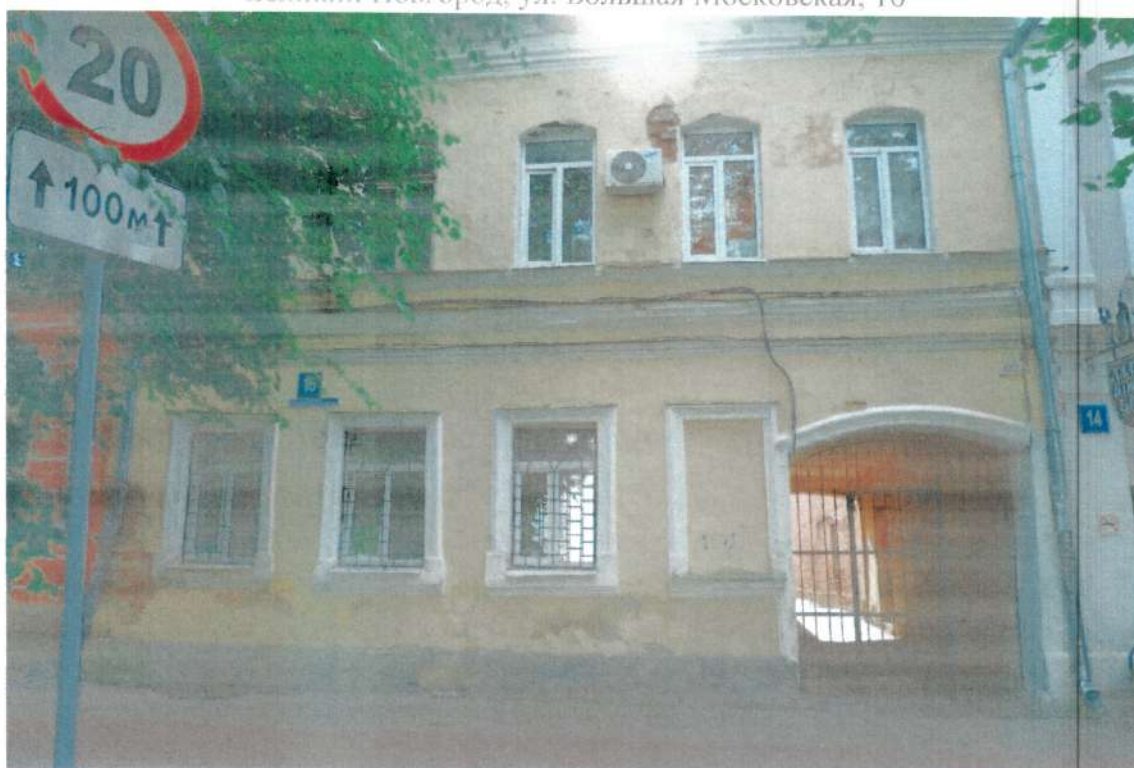
Фото 1. Западный (лицевой) фасад. Июнь 2020 года.