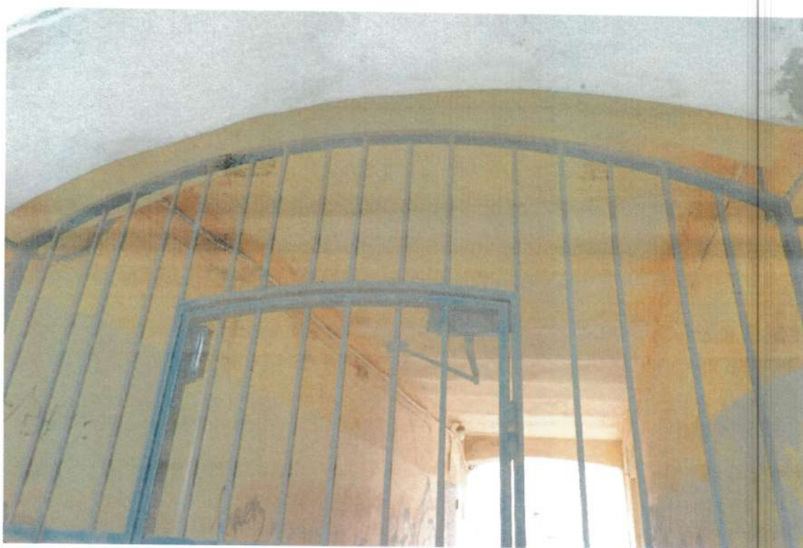
Фото 5. Металлический забор по периметру бастиона в проездной арке. Июнь 2020 года.