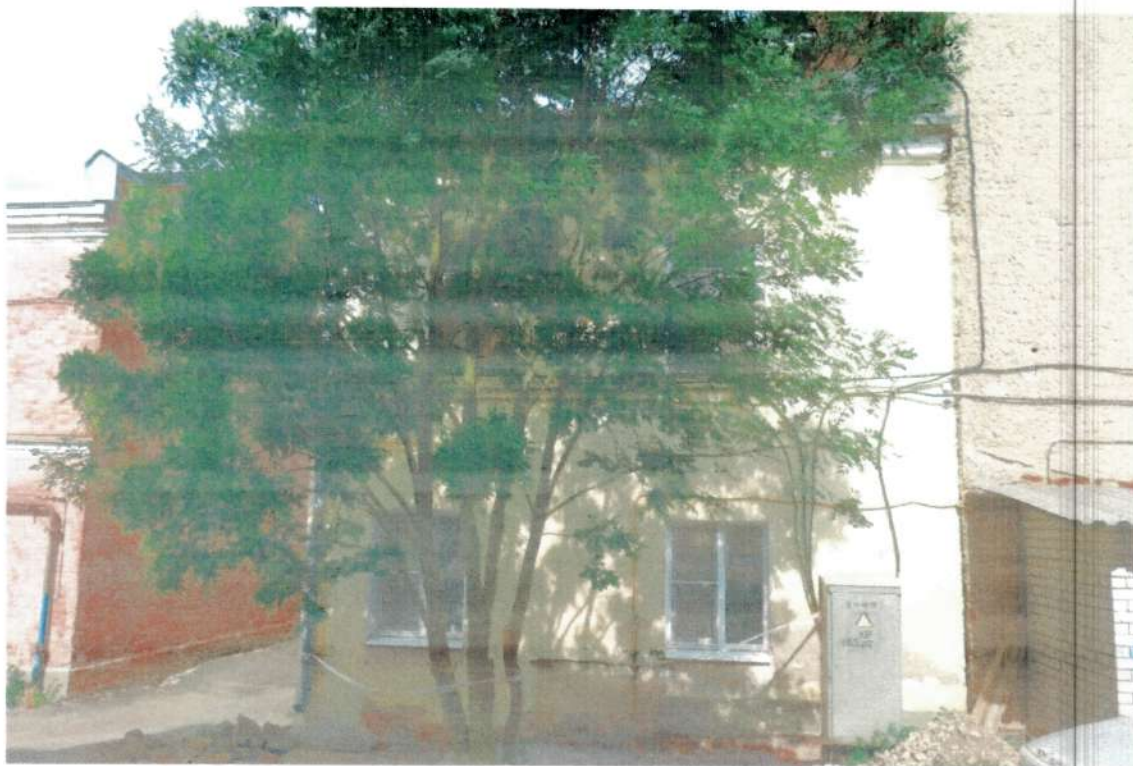
Фото 1. Внешний фасад дома периода 1905 года. Июнь 2020 года.