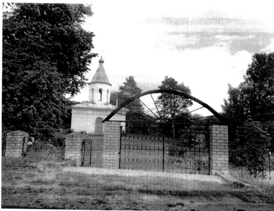
Фото 6. Современные въездные ворота и калитка по западной линии ограды. Вид с запада. 2020 год.