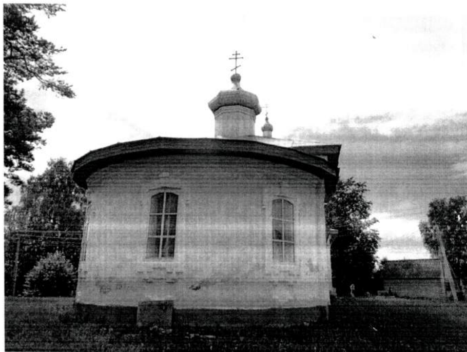
Фото 4. Западный фасад памятника (апсида). Вид с востока. 2020 год.