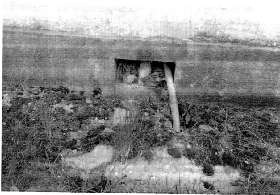
Фото 5. Продух в цокольной части церкви на южном фасаде. Вид с юга. 2020 год.