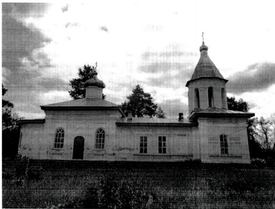
Фото 1. Северный фасад памятника. Вид с севера. 2020 год.